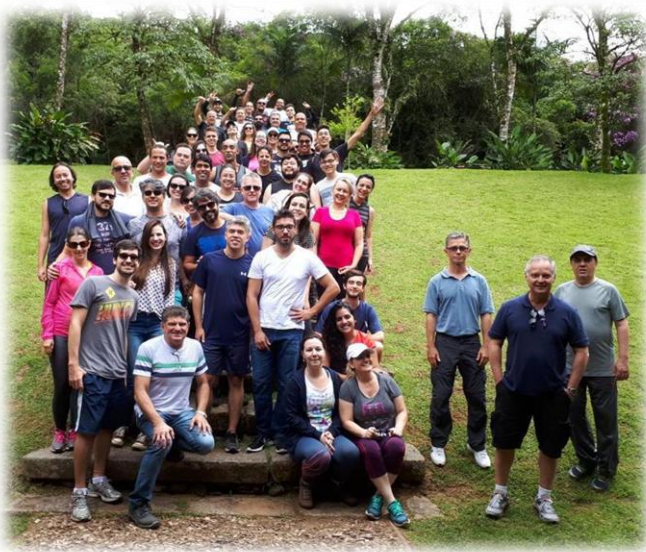
Equipe de P&D Suzano em 2018 – Parque das Neblinas