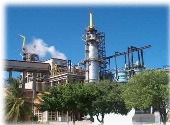
Riocell & Aracruz