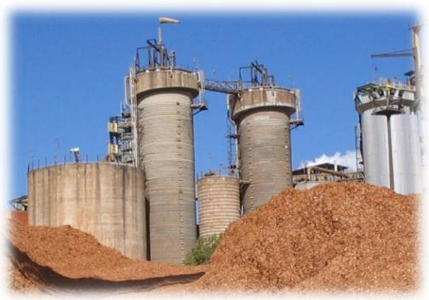
UFV & Cenibra