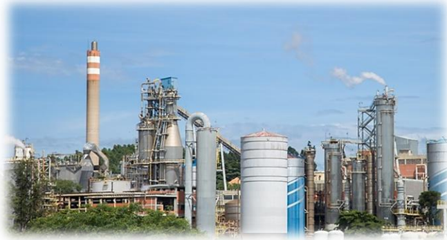
Suzano Limeira (Extração de Lignina)